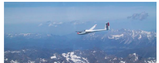
Leistungsabzeichen Silber-C, Gold-C

Die Segelflugausbildung steht auch Nicht-Gesamtschülern offen. Kontakt: info@aeroclub-rhwd.de